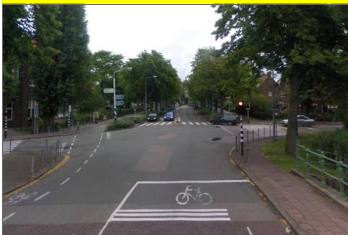
Veiligheid kruispunt Draafsingel, Pakhuisstraat, Messchaertstraat